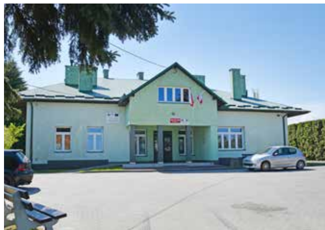
Dom Kultury w Kielanówce