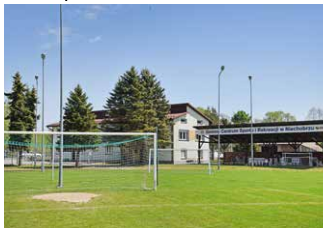
Gminne Centrum Sportu i Rekreacji w Niechobrzcu

• Modernizacja Gminnego Centrum Sportu i Rekreacji w Niechobrzcu - renowacja bieżni, budowa toru do jazdy na rolkach, modernizacja i rozbudowa wiaty, remont budynku, modernizacja oświetlenia stadionu.