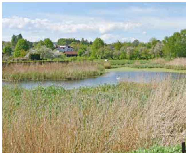
Staw w Zgłobniu

• Przebudowa stawu w Zgłobniu - zadanie obejmuje rewitalizację stawu i przywrócenie go do stanu pierwotnego. Staw będzie pełnił funkcję zbiornika retencyjnego, natomiast pozostała część zostanie przekształcona w teren rekreacyjny, w części z funkcją polderu zalewowego wykorzystywanego w przypadku zagrożenia powodziowego. Planuje się odmulenie i pogłębienie zbiornika, uregulowanie i umocnienie linii brzo-gowej, przebudowę przepustu pod drogą powiatową z budowlą pozwalającą na regulację poziomu wody w stawie, połączenie stawu z potokiem Lubcza, ogrodzenie terenu, roślinność porastającą brzegi oraz roślinność wodną w czaszy zbiornika.