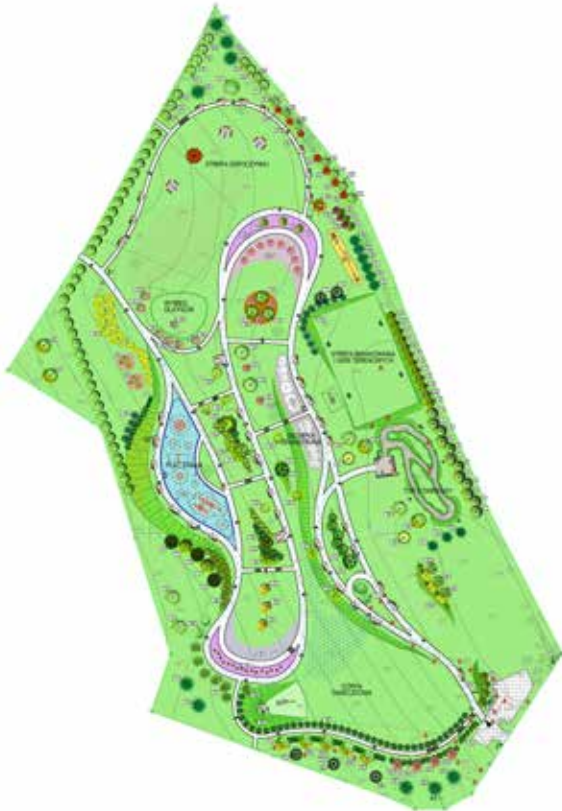
Wizualizacja parku przy ul. Słowackiego

• Budowa parku przy ul. Słowackiego - lokalizacja parku stanowi atrakcyjne miejsce zarówno dla obecnych mieszkańców, jak i dla młodych ludzi z dziećmi, którzy zamieszkają w planowanych do budowy przez spółkę SIM Podkarpacie 900 mieszkaniach. Budowa parku w nowej dzielnicy mieszkaniowej Boguchwały, na działce