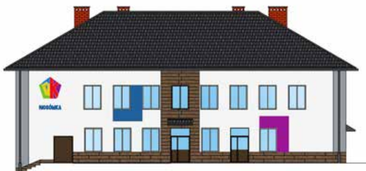
Wizualizacja zmodernizowanego ośrodka kultury w Nosówce