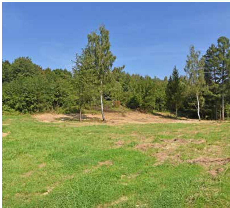
Teren przyszłego parku w Kielanówce

• Budowa parku w Kielanówce - w ramach zadania powstaną: nasadzenia zieleni, ścieżki spacerowe i rowerowe, tor rowerowy, place zabaw dla dzieci, boisko wielofunkcyjne - trawiaste, siłownia zewnętrzna, miejsca do wypoczynku, biwakowania i gier terenowych, zadaszenie do grillowania, górką saneczkowa, wybieg dla psów, elementy małej architektury, w tym ławki, leżanki, stojaki na rowery, kosze na śmieci, tablice informacyjne. Teren zostanie oświetlony oraz wyposażony w monitoring oraz parking. Powstanie kilometrowa ścieżka wzdłuż potoku Paryja, a sama powierzchnia parku wyniesie ok. 2,5 ha. Zakres projektu będzie odpowiadał na wspólne potrzeby, problemy i wyzwania rozwojowe w tym m.in. zapewnienie przyjaznej, funkcjonalnej oraz bezpiecznej przestrzeni publicznej, ze szczególnym uwzględnieniem dbałości o zachowanie i rozwój zielonej infrastruktury.