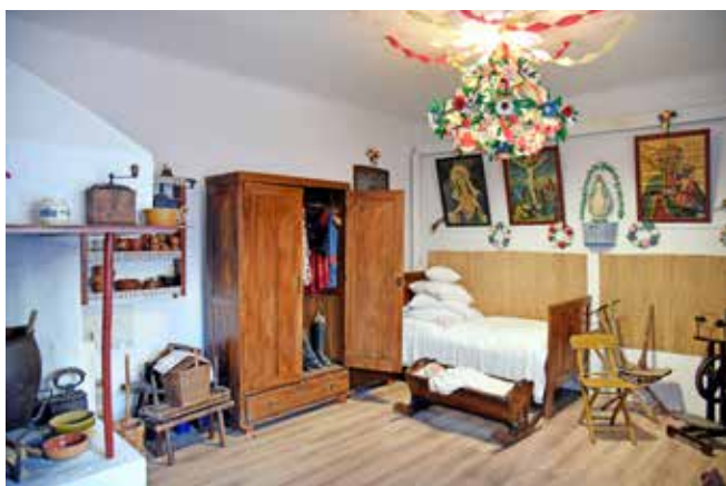
Izba Tradycji w Nosówce

• Utworzenie multimedialnych Centrów Dziedzictwa Niematerialnego - digitalizacja dóbr historyczno-kulturowych i prezentacja ich w nowych pomieszczeniach lub w Centrach Dziedzictwa Kulturowego w formie multimedialnej poprzez wyposażenie ich w np. ekrany interaktywne, rzutniki, komputery, odpowiednie nagłośnienie, tablice audiowizualne, sztalugi, gabloty, kamery do nagrywania itp. W pomieszczeniach będą gromadzone materiały związane z historią i tradycją danej miejscowości, które będą udostępnione z miejscowych zasobów, ale również dostarczane przez ich mieszkańców. Zastosowane zostaną standardy dostępności: architektonicznej oraz cyfrowej, wsparcie projektowe będzie dostępne dla ogółu społeczeństwa, w tym również, będzie odpowiadało na szczególne potrzeby osób z niepełnosprawnościami.