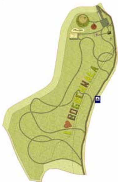
Wizualizacja terenów rekreacyjnych nad Wisłokiem

• Weekendowe spływy kajakowe Wisłokiem - w ramach zadania na terenie Wisłoczyska zostaną wykonane: pomost pływający, altana, teren do biwakowania, toalety, dojazd i miejsca postojowe, ciągi pieszo-rowerowe o długości 1,5 km i ścieżki spacerowe o długości 1 km. Celem projektu jest wzrost aktywnej turystyki, promocja gminy, podniesienia walorów turystycznych i rekreacyjnych regionu oraz wzrost gospodarki lokalnej. Wykonane zostaną nasadzenia oraz trawniki. W ramach projektu przewidziany do wykonania jest mostek prowadzący przez potok Mogielnicki.