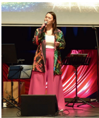
Boguchwalskie Forum Rozwoju

Pięć lat to z jednej strony zaledwie moment, a z drugiej – wystarczająco dużo czasu, by zbudować coś trwałego, wartościowego i zauważalnego. Boguchwalskie Forum Rozwoju to właśnie przykład inicjatywy, która w krótkim czasie przeszła drogę od idei do realnego wpływu na życie lokalnej społeczności. To historia zaangażowania, współpracy i wiary w to, że nawet niewielkie działania mogą prowadzić do dużych zmian.