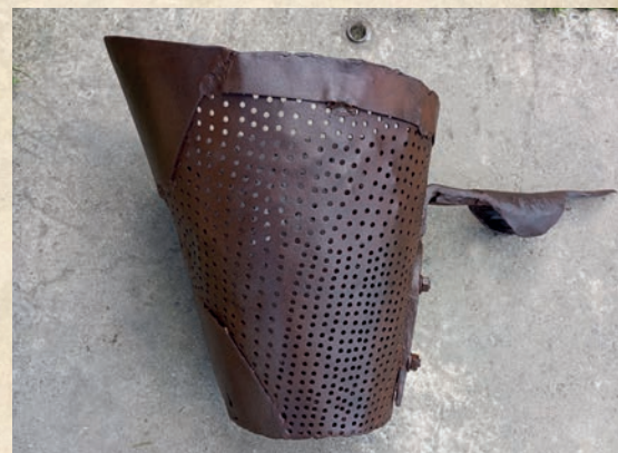
Oryginalny czerpak, którym pozyskiwano żwir i piasek.

ktos wyszedł na szczyt, to mu w piersiach gwizdało ze zmęczenia. Inna wersja jest taka, że na szczycie proszono delikwenta, który zasapany zdołał pokonać górkę, żeby zagwizdał. Jeżeli to uczynił, miało to świadczyć o jego kondycji fizycznej. Najprawdopodobniejszą wersją jest jednak taka, że w czasach kiedy droga była bardzo wąska, a w tym miejscu znajdował się jeszcze zakręt, przez co była ona niewidoczna, a jeszcze u podnóża płynęła rzeczka, to pojazdy zjeżdżające i wyjeżdżające mogły by się nie rozminąć, więc dawano znać gwizdaniem że ktoś wyjeżdża, wtedy ten na górze czekał, lub odwrotnie. To miejsce było niezwykle niebezpieczne. Zdarzało się tu dużo wypadków. Bo albo przy zjeżdżaniu koń nie zdołał utrzymać ciężaru wozu pomimo hamowania na „ostro”, (to znaczy przywiązywało się łańcuchem szprychę tylnego koła do sfory, wtedy koło sunęło po drodze nie obracając się) albo przy wyjeżdżaniu, kiedy koń nie był w stanie pokonać wzniesienia, wóz się cofał i przeważnie zatrzymywał się dopiero w rzece. W „żelazniakach” oprócz hamowania na ostro, jako hamulce na przednie koła stosowano tzw. „sukę”. Była to dosyć gruba belka w odpowiedni sposób zamontowana