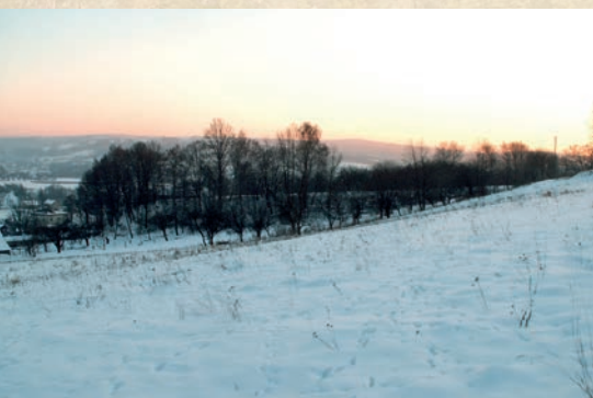
Stróża zarzecka, dziś w Babicy.

i od spraw wodnych jak widać, nie zawsze się udawało zapobiec nieszczęściom, a sam św. Jan niejednokrotnie został dotkliwie poturbowany i strącony do rzeczki, podczas tak licznych tu wypadków.