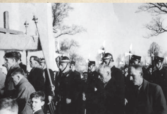
Rezurekcja - Zgłobień, fot. E. Włodyga

wstrzymywano się od prac rolniczych. Po południu przy grobie Pańskim zaciągały się stráže grobowe. Byli to strażacy w odświętnych, galowych mundurach. Mieli hełmy na głowie, w rękę trzymali halabardy a przy pasku mieli przypiętą szablę. Z Wielkim Piątkiem wiąże się też zwyczaj „wieszania barszczu”, który był główną potrawą w okresie wielkiego postu. Była to zabawa, której ofiarą padali naiwni chłopcy, nie znający tego obrzędu. Jeden chłopak wychodził na drzewo z garnkiem, z barszczem a drugiemu nakazywano stanąć pod drzewem i patrzeć jak się wiesza barszcz. I nagle na żądnego widowiska lał się barszcz z garnka.