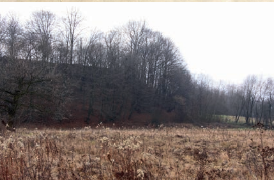
Stróża w Siedliskach.