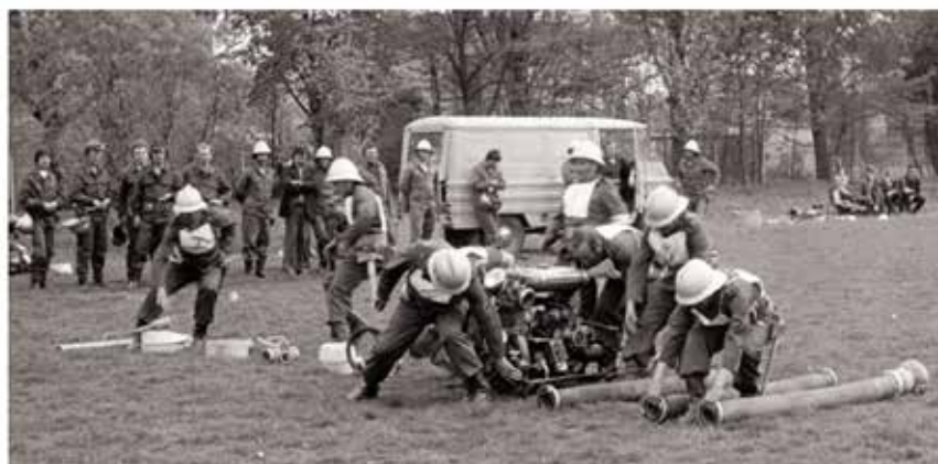
Zawody Zakładowych Ochotniczych Straży Pożarnych. Teren stadionu piłkarskiego ZKS Izolator Boguchwała.

75-rocznica powołania lutoryskiej Ochotniczej Straży Pożarnej stała się okazją do powstania niniejszego wydawnictwa pt. „Ochotnicza Straż Pożarna w Lutoryżu 1947–2022. Tradycja – Służba – Tożsamość”. Rozdziały publikacji są krótkie. Zostały tak pomyślane, iż zawierają najważniejsze zjawiska istotne dla miejscowej jednostki, tj. otwarcie remizy, poświęcenie wozu bojowego, przekazanie sztandaru. Nie brakuje historii pierwszych lat, strażackich biogramów oraz czasów współczesnych i działalności na niwie społecznej.