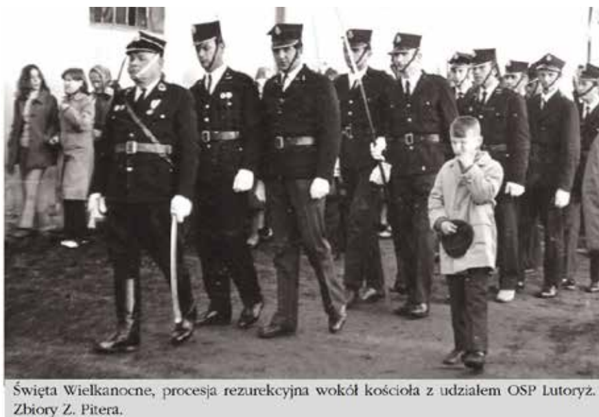
Święta Wielkanocne, procesja rezurekcyjna wokół kościoła z udziałem OSP Lutoryż.