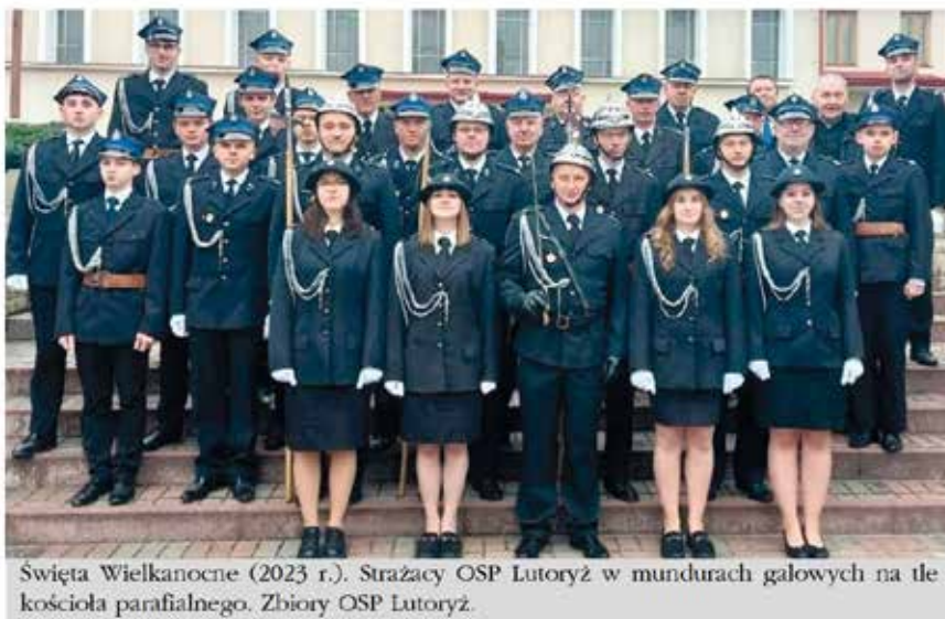
Święta Wielkanocne (2023 r.). Strażacy OSP Lutoryż w mundurach galowych na tle kościoła parafialnego.