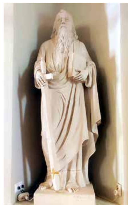
Posąg św. Pawła w kościele michalitów w Miejscu Piastowym