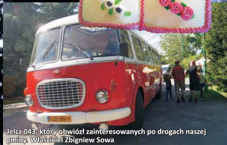
Jelcz 043, który obwioził zainteresowanych po drogach naszej gminy. Właściciel Zbigniew Sowa