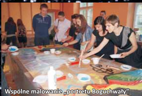
Wspólne malowanie „portretu Boguchwały”