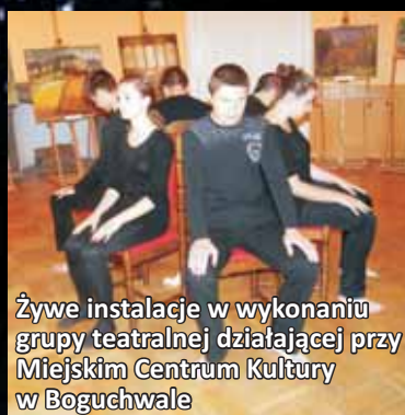
Żywe instalacje w wykonaniu grupy teatralnej działającej przy Miejskim Centrum Kultury w Boguchwale