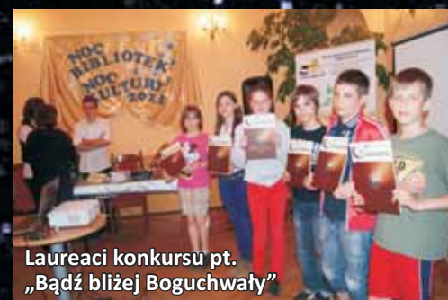
Laureaci konkursu pt. „Bądź bliżej Boguchwały”