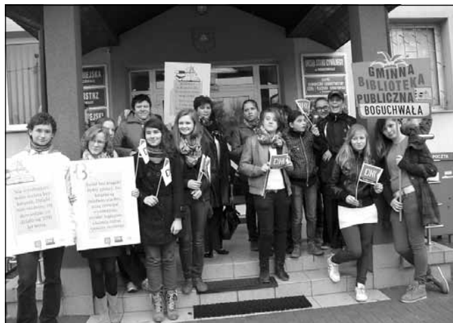
Happening czytelniczy przed Urzędem Miejskim w Boguchwale