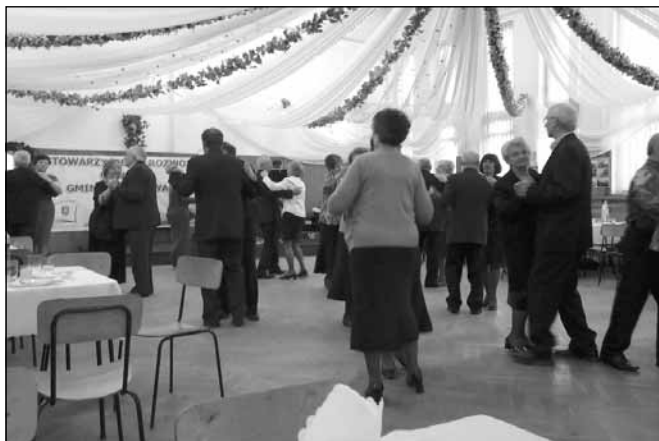
Spotkanie podsumowujące projekt.

Utworzony portal dla seniorów będzie aktywny także po zakończeniu projektu, dlatego też zapraszamy seniorów oraz wszystkich zainteresowanych do czynnego korzystania ze strony internetowej: www.seniorzy.boguchwala.pl .