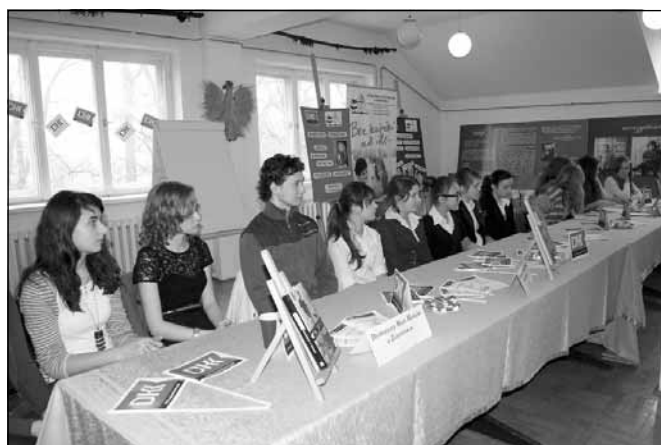
Przedstawiciele Dyskusyjnych Klubów Książki z Zabratówki, Straszdyła i z Boguchwały