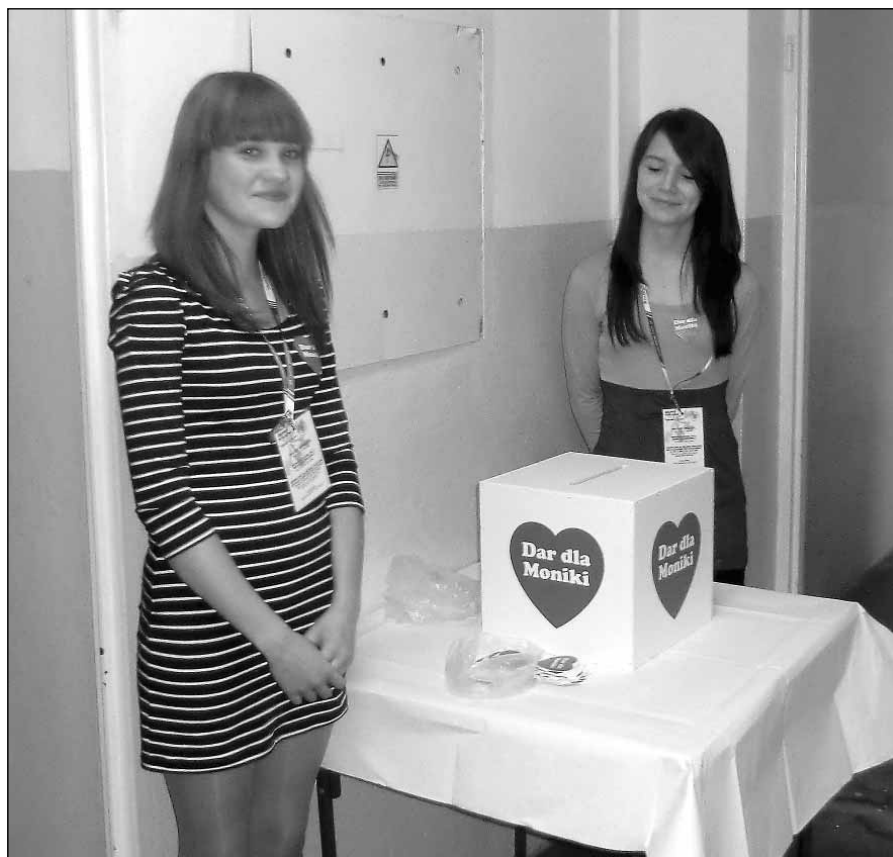
Wolontariuszki, które włączyły się w akcję charytatywną