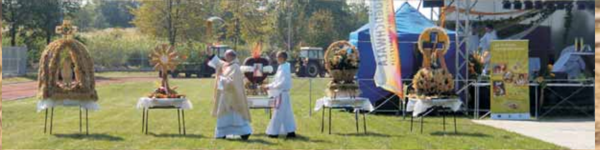
Poświęcenie wieńców dożynkowych i zmodernizowanego stadionu