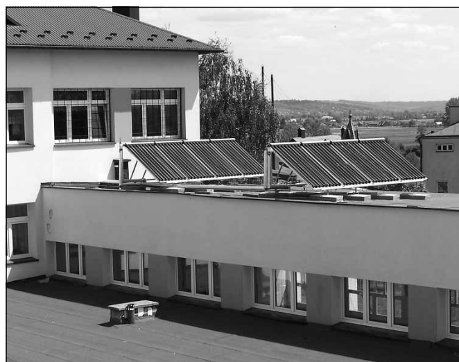
Zainstalowane kolektory na budynku Szkoły Podstawowej w Boguchwale

W gminie Boguchwała projekt realizowany był w dwóch etapach. Pierwszy został zrealizowany w 2006 r. i obejmował termomodernizację Szkoły Podstawowej w Zgłobniu, w Nosówce, w Woli Zgłobieńskiej, w Boguchwale oraz Zespołu Szkół w Niechobrze. Etap drugi został zrealizowany w tym roku i dotyczył Domu Ludowego w Kielanówce i w Nosówce, gdzie wykonano termomodernizację i budowę kotłowni gazowej. LOK „Wspólnota” w Zgłobniu, Dom Ludowy w Lutoryżu, w których wykonano termomodernizację i instalacje mikrobloku grzewczo-energetycznego zapewniającego oszczędność energii, obniżenie emisji dwutlenku węgla, przy jednoczesnym wytwarzaniu ciepła i energii elektrycznej zapewniając tym samym opłacalne i ekologicz-