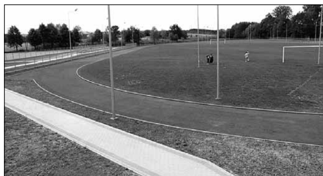
Obecna płyta, bieżnia i trybuny Gminnego Centrum Sportu i Rekreacji

4 września oficjalnie otwarto bramy zmodernizowanego stadionu sportowego w Niechobrzu. Nowe oblicze obiektu, to także nowa jego nazwa – Gminne Centrum Sportu i Rekreacji.