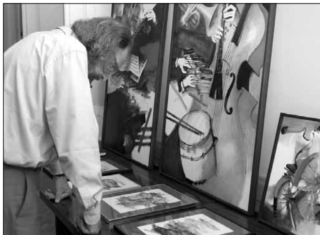
Nad sztuką trzeba się pochylić