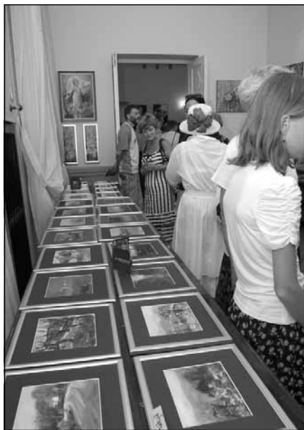
Plener malarski zgromadził wielu pasjonatów