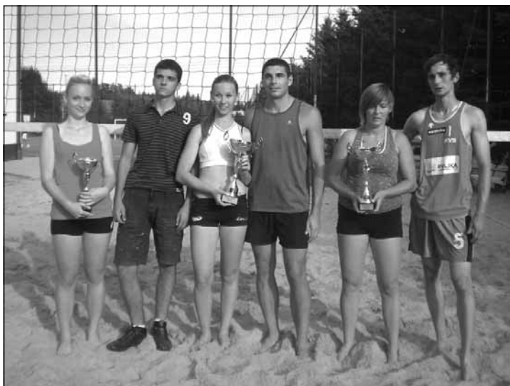
Trójka finalistów LUBCZA CUP