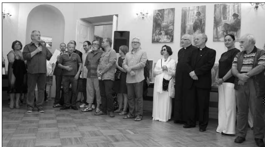
Artyści VII Pleneru Malarskiego w Boguchwale