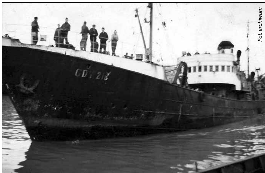
Tak wyglądał „Wisłok” – na zdjęciu bliźniacza „Raba” (Gdy-216)

Trawlery były udane, ale nie niezniszczalne, niestety. Jako pierwsza przekonała się o tym załoga naszego „Wisłoka”. W piątym roku pływania statek skierowany został na łowiska północnego Atlantyku, w pobliże Islandii. Rejs okazał się dlań ostatni: 5 kwietnia 1964 r. (inne źródła podają, że stało się to 25 lutego) polski trawler podczas sztormu został wyrzucony na mieliznę koło Krossandur, na południowym brzegu wyspy. Unieruchomioną jednostkę ściągnięto wprawdzie na wodę, ale uszkodzenia kadłuba były poważne i za ich przyczyną statek 7 kwietnia (albo 27 lutego) definitywnie zatonął w trakcie holowania do wysp Vestmannaeyjar. Wrak osiadł na głębokości 47 metrów. Dzięki pomocy helikoptera Sił Powietrznych Stanów Zjednoczonych, stacjonującego w bazie