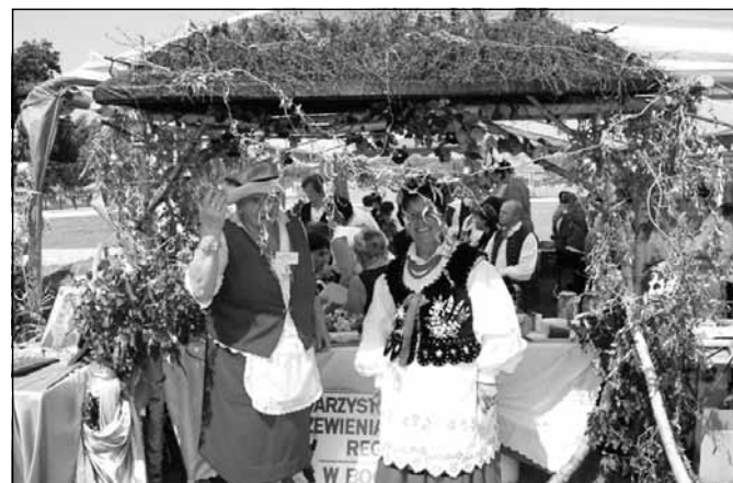
Stoisko promocyjne Gminy Boguchwała