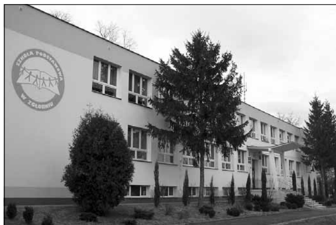
Szkoła Podstawowa w Zgłobniu

Projekt obejmował termomodernizację gminnych obiektów kubaturowych i był współfinansowany ze środków Unii Europejskiej z Europejskiego Funduszu Rozwoju Regionalnego w ramach Regionalnego Programu Operacyjnego Województwa Podkarpackiego na lata 2007-2013. Wartość in-