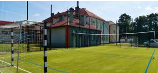
Boisko SP Mogielnica - 131 288 zł