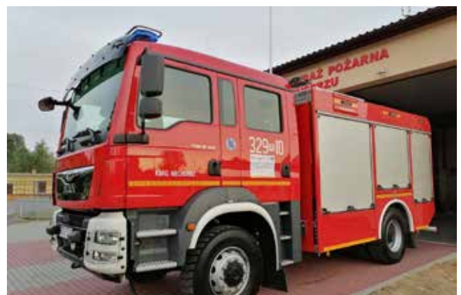
Dofinansowanie zakupu wozu OSP Niechobrz - 886 583 zł