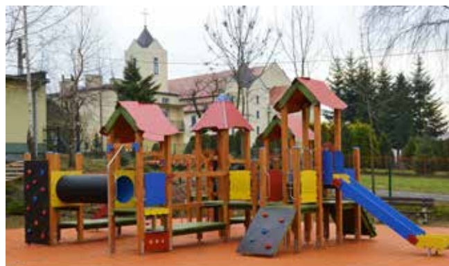
Doposażenie placów zabaw