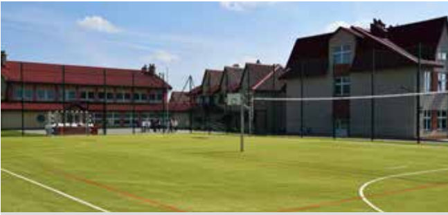
Boisko przy SP Lutoryż - 263 031 zł