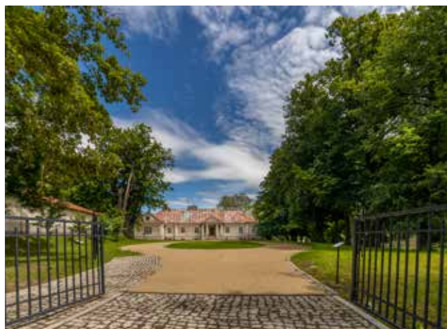
Przebudowa parku w Zgłobniu - 1 166 040 zł

Ponad 90% gospodarstw domowych jest obecnie na terenie naszej gminy podłączonych do sieci wodociągowej i kana-