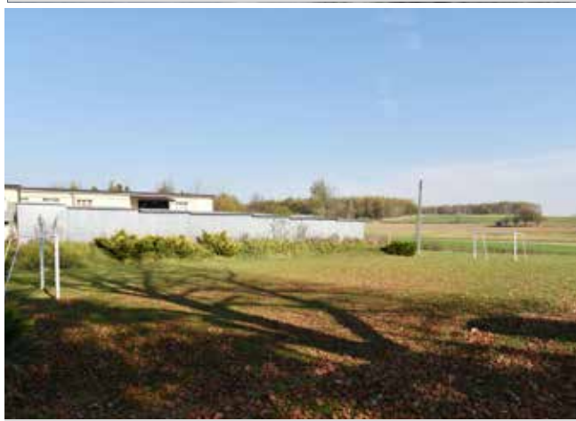
Boisko przyszkolne w Zgłobniu