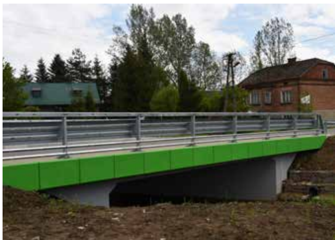
Dotacja do przebudowy mostu w Zgłobniu - 500 000 zł

Wspólnie ze Starostwem Powiatowym w Rzeszowie zrealizowaliśmy kolejne odcinki chodników m.in. w Mogielnicy, czy przebudowaliśmy most na rzece Lubcza w Zgłobniu. Trwa budowa zjazdu z trasy S-19, w którym również partycypuje Gmina Boguchwała kwotą 5 mln zł.