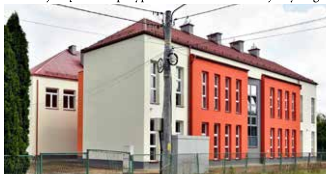
SP Mogielnica - 3 647 628 zł