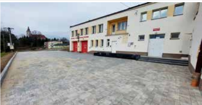
Teren przy DK w Zgłobniu - 303 019 zł

ne są zgody i wykupy gruntów prywatnych. W tym miejscu chciałbym podziękować wszystkim mieszkańcom, którzy byli i są w stanie zrozumieć potrzeby rozwojowe, którzy oddali lub sprzedali swoje grunty pod inwestycje publiczne umożliwiając mieszkańcom, ale i sobie, dojazd do posesji.