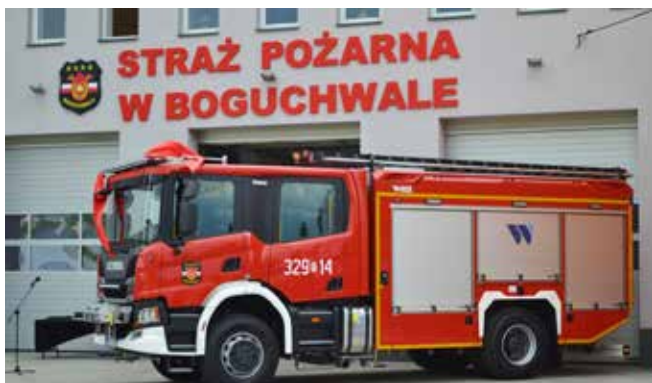
Dofinansowanie zakupu wozu OSP Boguchwała - 380 000 zł

W gminnym budżecie nie zabrakło również środków przeznaczonych na nasze bezpieczeństwo. To przede wszystkim wydatki na doposażenie OSP z terenu gminy. Rokrocznie na te potrzeby wydajemy około 100-150 tys. zł. Ponadto poczyniliśmy duże inwestycje, takie jak budowa nowej remizy w Zarzeczcu – koszt prawie 1,8 mln zł, zakup nowych samochodów ratowniczo-gaśniczych dla jednostek w Niechobrzu i Boguchwale – dofinansowanie gminy ok 500 tys. zł. Rozbudowujemy sieć monitoringu gminnego poprzez montaż nowych kamer w najbardziej newralgicznych miejscach gminy. Dodatkowo przekazaliśmy środki dla Policji na zakup nowego samochodu służbowego.