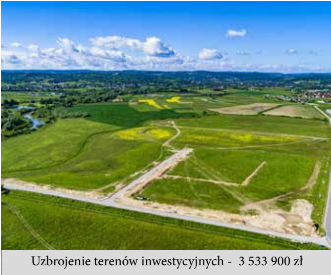
Uzbrojenie terenów inwestycyjnych - 3 533 900 zł