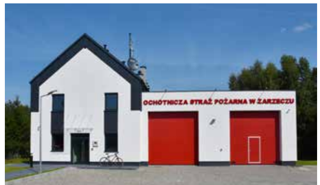
Budowa remizy w Zarzeczcu - 1 401 081 zł

Bardzo ważnymi zadaniami były te związane z rewitalizacją obiektów w Boguchwale. Odnowiony został zabytkowy Spichlerz na rynku. Obecnie jest to Centrum Wspierania Przedsiębiorczości oraz restauracja Genius Loci prowadzona przez naszą spółkę komunalną Boguchwalskie Forum Rozwoju. Drugim obiektem zrewitalizowanym jest remiza OSP w Boguchwale przy ul. Kolejowej. Budynek ogromnie zaniedbany z przerdzewiałym dachem i nieszczelnymi oknami doczekał się gruntownej przebudowy. Obecnie pełni funkcję Centrum Rozwoju Społecznego, w którym każdy mieszkaniec gminy może znaleźć ciekawe zajęcia dla siebie i całej rodziny. Zadania te realizowane były dzięki wsparciu z Regionalnego Programu Operacyjnego Województwa Podkarpackiego. W samej Boguchwale oddaliśmy także do użytku odremontowany budynek dworca PKP wraz z ul. Kolejową. To elementy dużego projektu transportowego realizowanego w ramach Rzeszowskiego Obszaru Funkcjonalnego. Również dzięki temu projektowi po naszej gminie jeżdżą nowe autobusy MKS.