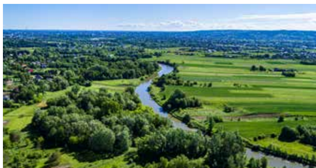
Budowa ścieżki spacerowej wzdłuż Wisłoka