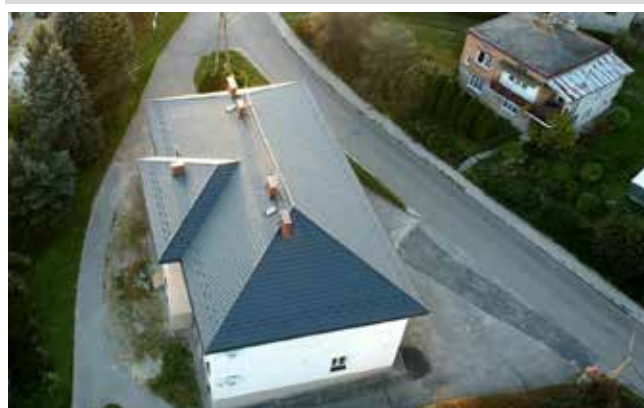
Remont DK w Nosówce - 207 085 zł

lizacji sanitarnej. Co roku są wykonywane nowe odcinki sieci. W ostatnich 3 latach powstało 8 km sieci wodociągowej oraz 6,5 km kanalizacji sanitarnej za kwotę ponad 2 mln zł.