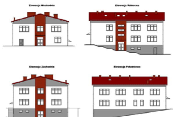
Żłobko-przedszkole w Kielanówce