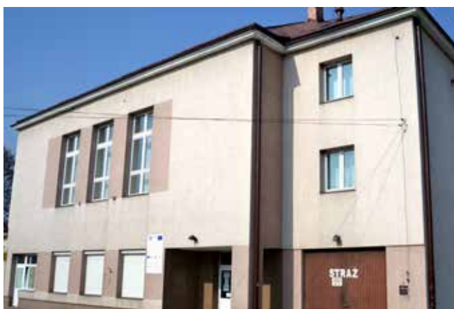
Przebudowa DK w Zarzeczcu