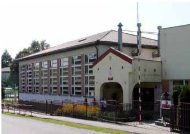
Przebudowa sali gimnastycznej SP Nosówka