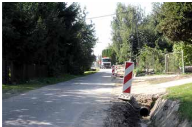
Przebudowa dróg w Niechobrzez