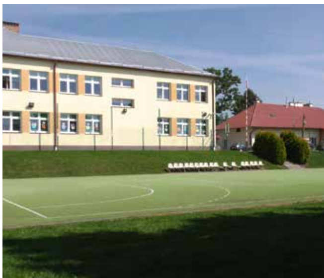
Remont boiska przy SP Raclawówka