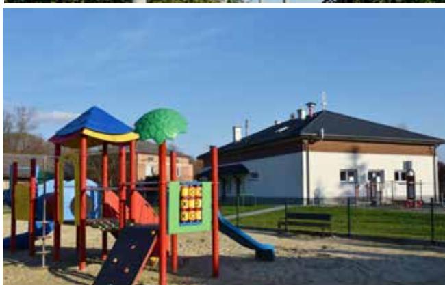
Plac zabaw w Nosówce - 189 604 zł