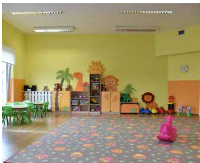
Kolejny żłobek w Boguchwale